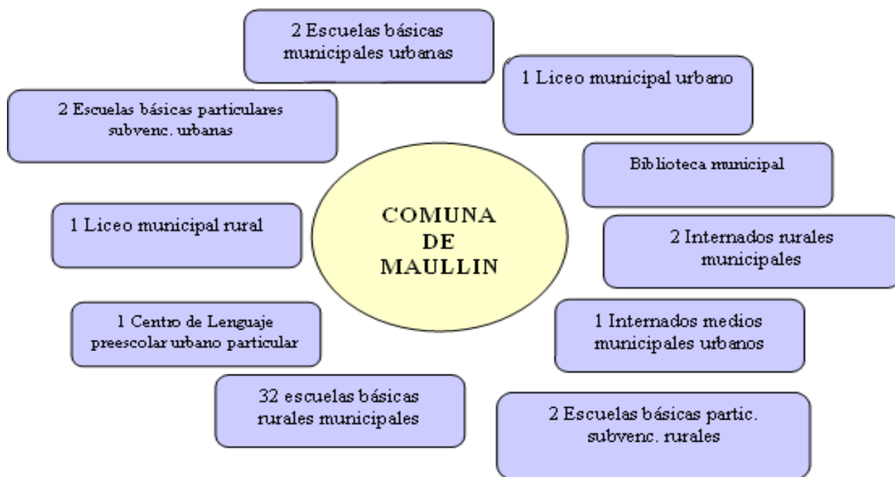
Imagen: Red Comunitaria en Educación.

Por último, el Plan de Salud Comunal de Maullín 10 representa como “Red Comunitaria en Educación” lo siguiente: